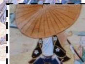
Szogan wiecznie ukryty za parasolem – ile razy uda się go odszukać na parawanie?

Edo-zu Byōbu, składający się z dwóch skrzydeł o szerokości 366 cm każde parawan z niesamowitą precyzją przedstawia panoramę miasta Edo, późniejszego Tokio. Zamek Edo-jō przyciąga uwagę swoim rozmiarem, a takie miejsca jak most Nihombashi można porównać z ich dzisiejszym odpowiednikiem. Ale mało kto wie, że ten bogaty w złoto parawan tak naprawdę spełniał funkcję użytkową i w swojej epoce nie był „dziełem sztuki” w naszym rozumieniu tego słowa. Służył jako przenośna ścianka, ustawiana tylko wtedy, gdy chciano podzielić szeroką przestrzeń pokoju.