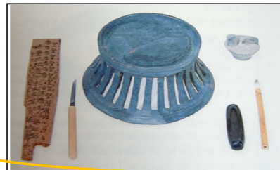
Mokkan i przybory do pisania (3)

Wśród muzealnych eksponatów rzucają się nam czasem w oczy figurki ludzi i zwierząt – „dawne zabawki?”, myślimy od razu. Nie są to jednak zabawki ówczesnych dzieci. Figurki przedstawiające ludzi – hitogata – i konie – doba – poświęcane i palone w świątyni lub puszczane z biegiem rzeki miały za zadanie zabrać ze sobą choroby, które dręczyły właściciela.